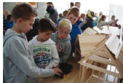
Fra Kulturfestivalen ved Kastellet skole.