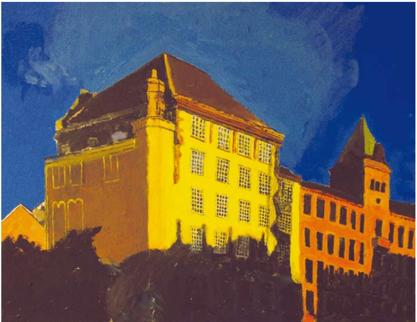
Karl Johans gt 1, Jernbanetorget