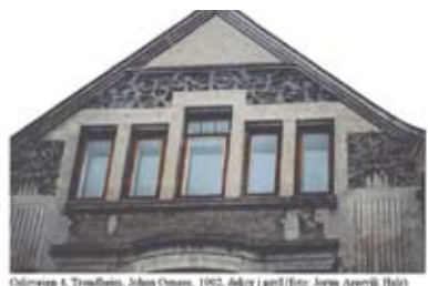
Osloveien 4, Trondheim, Johan Osness, 1902, dekor i gavl