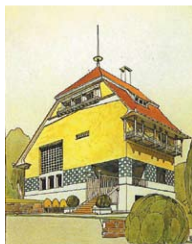
Haus Olbrich, Darmstadt, Joseph Maria Olbrich, 1901 (tegning: Russell, Frank: (red.): Art Nouveau Architecture, London: Academy Editions, 1979)

Bygningene vi nå har tatt for oss, viser bruk av flere bygningsmaterialer. Vi har sett eksempler på bruk av både naturstein, pusset mur og teglstein. Det dekorative program var på samme vis variert, med bruk av nasjonalt forankret ornamentikk, eller dekor med internasjonale paralleller. Noen arkitekter valgte dekoren vekk eller gjorde avmålt bruk av geometriske former, andre brukte former fra naturen. Noen valgte å blande de ulike dekorformene. De bygningene artikkelen har omtalt gir et innblikk i hvor individuell arkitekturen fra denne perioden var.