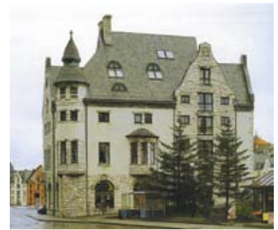
Notenesgata 9, "Rønnebergbua", Ålesund, Karl Norum, 1906, (foto: Jiri Havran, her fra Grytten, Harald: Jugendbyen Ålesund, Oslo: ARFO, 1996)