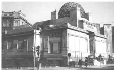
Wienersecessionens utstillingsbygning, Wien, Joseph Maria Olbrich, 1897-98