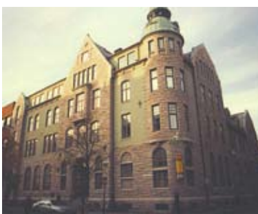
Dronningens gate 10, "Posthuset", Trondheim, Karl Norum, 1907-13

I 1904-05 tegnet Karl Norum åtte bygninger i Ålesund. Mot slutten av denne perioden utviklet han en nasjonal og særpreget stil, som kommer til uttrykk for eksempel i Notenesgata 9, "Rønnebergbua", fra 1906. Denne stilen innebar bruk av råkopp, grovt tilhugget naturstein, som fasadekledning, og middelalder og/eller vikingestilinspirerte bygningsformer og dekor. Norum tok denne stilen med seg tilbake til Trondheim. Dronningens gate 10, "Posthuset", ble oppført i 1907-13. Om bygningen ikke kan kalles "Rønnebergbua"s tvilling, er det i alle fall ingen tvil om at de har samme opphav.