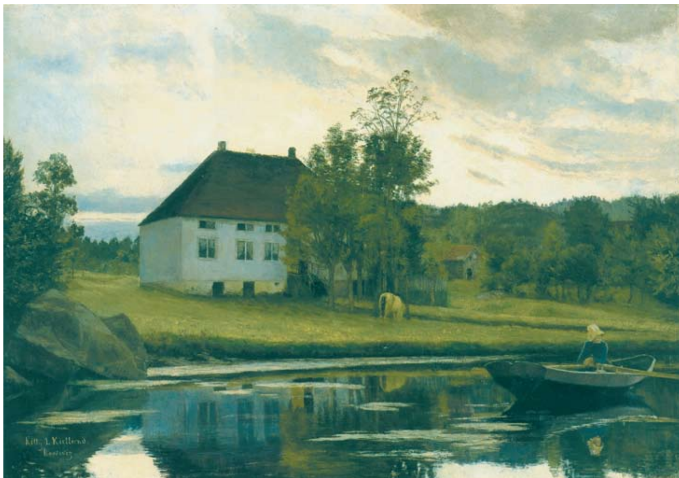
Kitty L. Kielland, Etter solnedgang, 1885. Kitty Kielland fant motivet i Bosvik, like utenfor Risør. Hun holdt seg nøye til naturforbildet, men det er kveldsstemningen som er bildets vesentlige innhold.