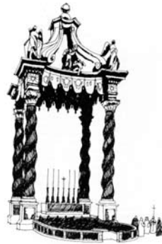
Gianlorenzo Bernini tegnet bronsebaldakinen med spiralsøyler over høyalteret i Peterskirken i Roma i samarbeid med Francesco Borromini.