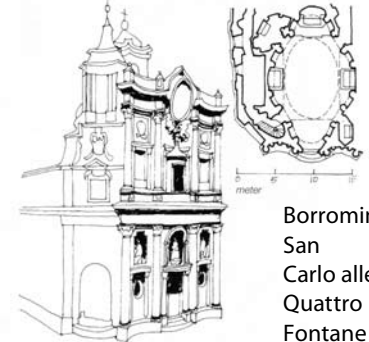
Borrominis San Carlo alle Quattro Fontane (1638)